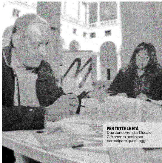
PER TUTTE LE ETÀ Due concorrenti al Ducale. C'è ancora posto per partecipare quest'oggi

dinario di Analisi matematica al Politecnico di Milano ed esperto di teoria dei giochi, terrà una conferenza dal titolo "SuDoKu e giochi matematici": «È divertente trovarsi con gli amici a sfidarsi a risolvere le griglie. Farlo in compagnia è molto più divertente. L'importante è che le persone la prendano col giusto spirito». Un segreto per i neofiti. «In questo gioco mate-psico-filosofico, ci vuole sistematicità, pazienza e intuizione».